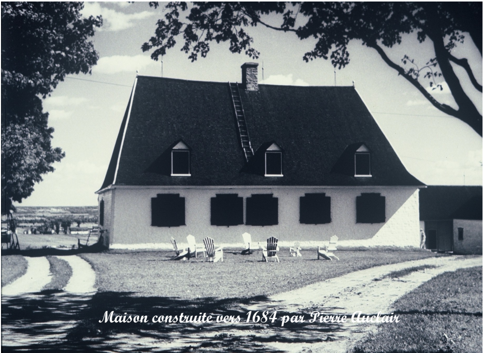
Maison construite vers 1684 par Pierre Auclair

L'ASSOCIATION DES AUCLAIR D'AMÉRIQUE CASE POSTALE 6700, SILLERY, QUÉBEC, G1T2W2 TÉLÉPHONE : (418) 653-2137 TÉLÉCOPIEUR : (418) 653-6387